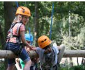
↑ Klettern im Seilgarten

Diese Veranstaltung ist in 2020 ebenfalls coronabedingt abgesagt worden. Wir bauen weiter unsere Inhalte auf Facebook und auf Instagram aus. Wir nutzen die Sozialen Medien, um Einblicke in unsere Seminare, Freizeiten etc. zu geben und so schnellstmöglich viele Leute zu erreichen. Die Anmeldungen zu unseren Freizeiten und Seminare werde mittlerweile fast ausschließlich „online“ getätigt.