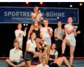
↑ Entdeckertag 2020 im Zirkuszelt

Eine feste Veranstaltung der SportRegion ist der vom Regionssportbund organisierte Sport-Kongress . Fast 200 Teilnehmende informieren sich jährlich über aktuelle Themen der Sportentwicklung. In 2020 und 2021 waren leider nur Online-Veranstaltungen mit Workshops möglich. Eine weitere gemeinsame Veranstaltung der SportRegion ist die Ausrichtung des Sportbereiches im Rahmen des zentralen Festes des Entdeckertages der Region Hannover auf dem Georgsplatz. Jedes Jahr präsentieren sich zahlreiche Vereine auf der Sportbühne und mit Mitmach-Aktionen auf der Spielstraße. Ohne großen Planungsvorlauf hat der SSB 2020 gemeinsam mit seinen Vereinen und in Kooperation mit dem Haus der Jugend einen Entdeckertag im kleinen Format auf die Beine gestellt, um Gruppen nach monatelangen Veranstaltungsabsagen eine Bühne für ihre Aktivitäten zu bieten.