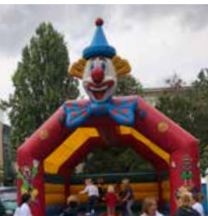
↑ Hüpfburgen im Verleihservice der HSJ