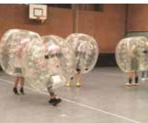
↑ Bubblesoccer beim Mitternachtssport

Ein weiterer Baustein war in diesem Zuge eine Veränderung im Lager des Verleihservices . Hier wurde ein Lagersystem gefunden, welches alle Reservierungen über die Homepage abbildet, so dass sich auch der Leih- bzw. Bestellprozess deutlich vereinfacht. Das Lager wird aktuell umgeräumt, damit alle Vorgänge zügig und problemlos bearbeitet werden können. Beim Umräumen wurden viele veraltete Materialien ausgemustert und sollen, bei entspannterer Haushaltslage, neu angeschafft werden, um den Vereinen auch weiterhin diesen Service zu bieten. Hier wird ggf. auch eine Zusammenarbeit mit weiteren Partnern angestrebt, um die Kosten des Lagers zu reduzieren und das Angebot ggf. zu erweitern.