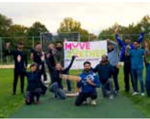
↑ „Move2gether“ bietet Sport für Geflüchtete.

gegen jegliche Form der Ausgrenzung, der Ablehnung und des Extremismus einsetzen. Wir wollen Vereine unterstützen und auszeichnen, die gemeinsam mit uns Menschen für das Thema sensibilisieren, präventive Maßnahmen umsetzen und ein starkes Zeichen gegen jegliche Form der Diskriminierung setzen. Eine enge Zusammenarbeit besteht mit der beim VfL Eintracht ansässigen „Koordinierungsstelle für Geflüchtete“. Mit Move2gether wurde ein Sportangebot an wechselnden Vereinsstandorten initiiert, bei dem Geflüchtete Sportarten und Sportorte in Hannover kennenlernen.