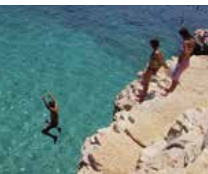
↑ Sommerreisen stehen hoch im Kurs.

Weiter entschied der Vorstand, die Räume der Geschäftsstelle in der Maschstraße aufzulösen und die Tätigkeiten künftig in der Geschäftsstelle des Stadtsportbundes auszuführen. Begründet wird dies zum einen mit der besseren Nähe zum Erwachsenenverband und der Schaffung neuer Synergien in der Projektarbeit. Weiter hat der Stadtsportbund zugesagt, dass der HSJ hierdurch keinerlei Kosten durch Mieten oder Verbrauch von Materialien etc. entstehen. Weiter unterstützt der SSB durch verwaltende Tätigkeiten, insbesondere durch die Übernahme der Buchführung. So konnte der Personalaufwand für die HSJ deutlich reduziert werden.