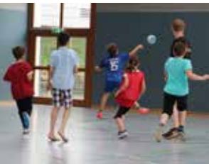
↑ Sport im Ganzttag mit den Vereinen

Über die Aktivitäten, insbesondere Jugendbildungsmaßnahmen und Ferienfreizeiten , der Hannoverschen Sportjugend (HSJ) wird auf dem Sportjugendtag am 10. Mai 2021 ausführlich berichtet. Ein schriftlicher Bericht ist in diesem Heft ab Seite 24 abgedruckt.