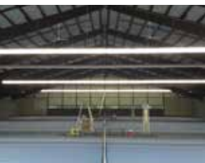
↑ Viele Sportanlagen leiden unter Sanierungsstau.