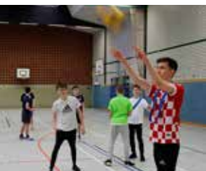
↑ Mitternachts- sport in sozialen Brennpunkten