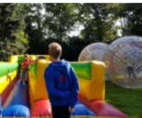
↑ Entdeckertag in Gailhof mit dem Stadtjugendring

Die Zusammenarbeit mit anderen Gremien, Organisationen und Verbänden war und ist uns wichtig, da hierdurch ein ständiger Erfahrungsaustausch gewährleistet ist. Die HSJ ist stimmberechtigtes Mitglied im Stadtjugendring Hannover . Der Stadtjugendring soll als übergeordneter Verband die Interessen aller Verbände vertreten, deren Meinungen bündeln und gegenüber der Stadt und der Politik die Verbände vertreten. Im Bereich des Stadtjugendrings (SJR) haben wir außerdem an den regelmäßigen Sitzungen teilgenommen und den Prozess zur Neuausrichtung des SJR begleitet. Wir hoffen und wünschen dem SJR mit seiner neuen Ausrichtung viel Erfolg.