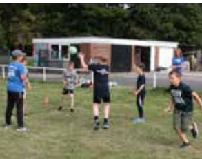
↑ Sport wirkt positiv auf die Kindesentwicklung.

Die überarbeiteten Grundsätze der Sportförderung wurden Anfang 2021 nach langer Diskussion verabschiedet,