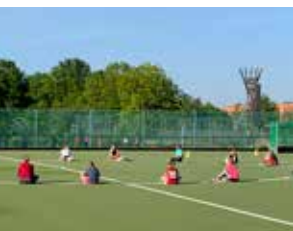
↑ Fußballtraining mit Abstand

Wenn wir uns in dieser Zeit Gedanken über Gesundheit machen, dürfen wir nicht vergessen, dass Sport und Bewegung ganz wesentlich dazu beitragen.