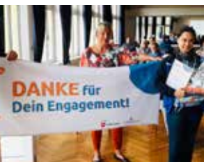
↑ „Ehrenamt überrascht“ stark nachgefragt

Themenschwerpunkt der Projektstelle „Ehrenamt“ ist zudem die Stärkung der Zusammenarbeit mit dem Freiwilligenzentrum Hannover . Im Rahmen einer Informationsveranstaltung wurde unter anderem die Möglichkeit vorgestellt, sich mit einer zu erledigenden Aufgabe eintragen zu lassen und somit Ehrenamtliche außerhalb des eigenen Sportvereins zu finden. Im Jahr 2019 koordinierte der SSB die Vorstellung von Freiwilligenarbeit in Vereinen auf der „Sports Area“ der Freiwilligenbörse im Pavillon Hannover. Eine Wiederholung der erfolgreichen Veranstaltung ist für März 2022 geplant.